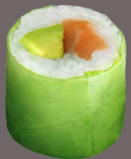
GREEN FEUILLE DE RIZ, FEUILLE DE LAITUE ET RIZ