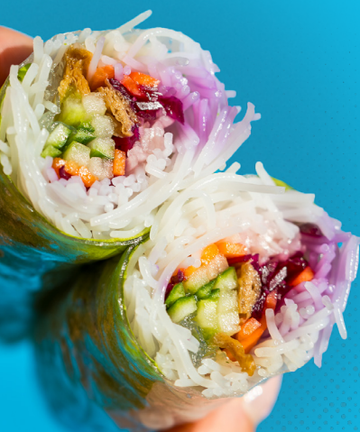
SPRING ROLL VÉGÉTARIEN